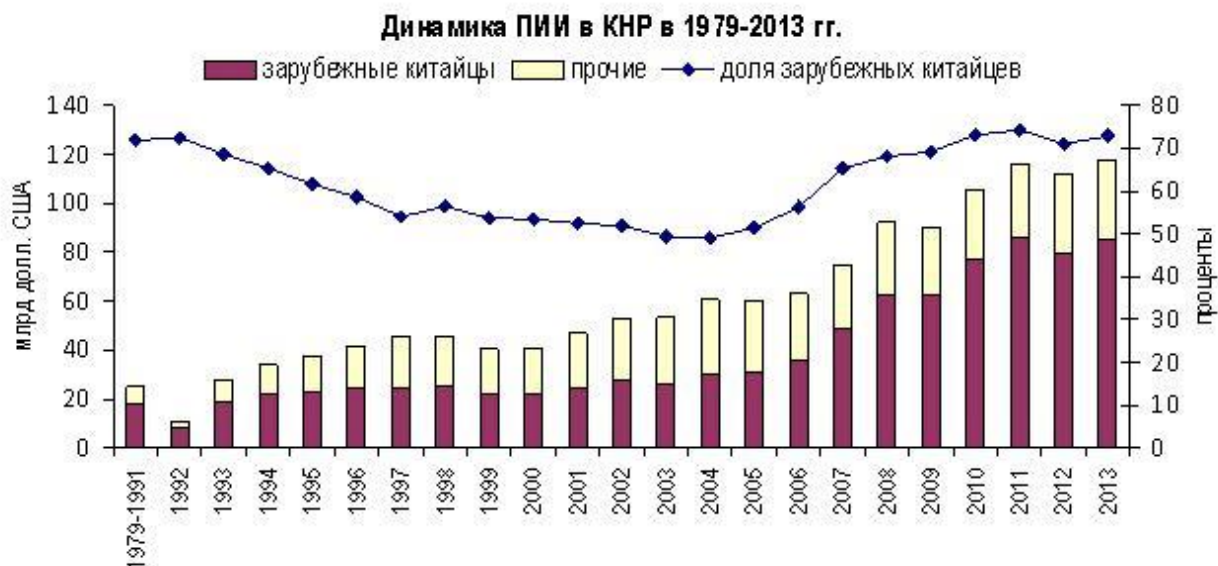
Таблица 1. Распределение китайцев – иностранных граждан по целям поездок в Россию, 2000 – 2014гг. (тыс. человек)